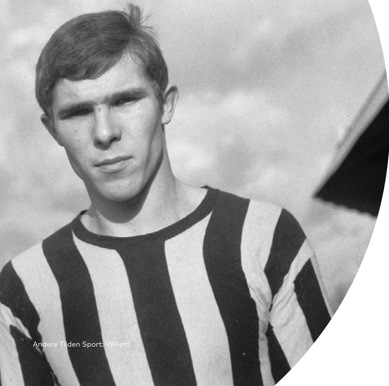
Andere Tijden Sport: Willem