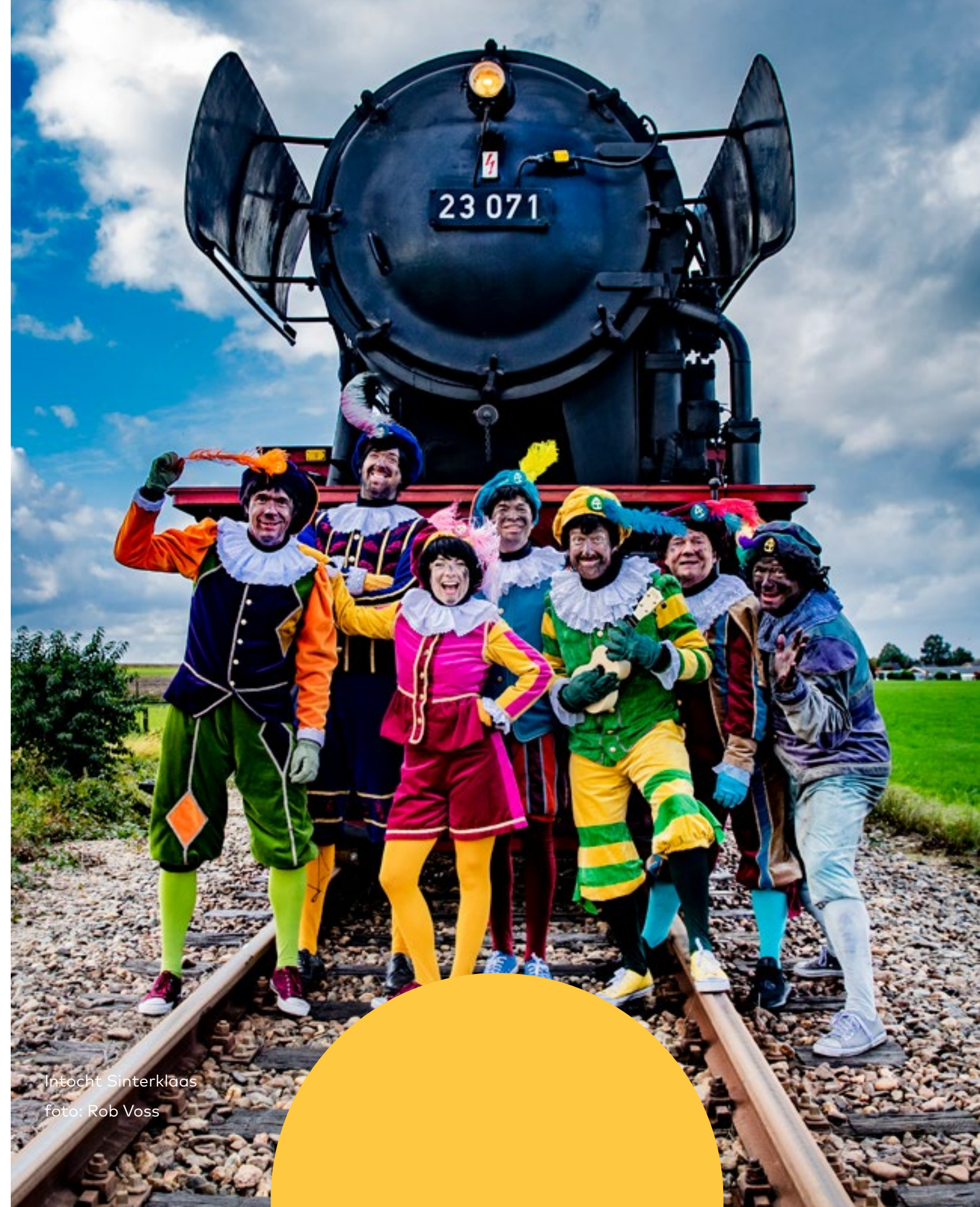
Intocht Sinterklaas

Ook Schooltv.nl innoveert met het ontwikkelen van een 'action' voor de smartspeaker, waardoor het voor gebruikers mogelijk is om te praten met Willem van Oranje zelf. De toepassing is zo'n succes dat het ontwikkelen van voice-applicaties in de komende jaren zal worden voortgezet.