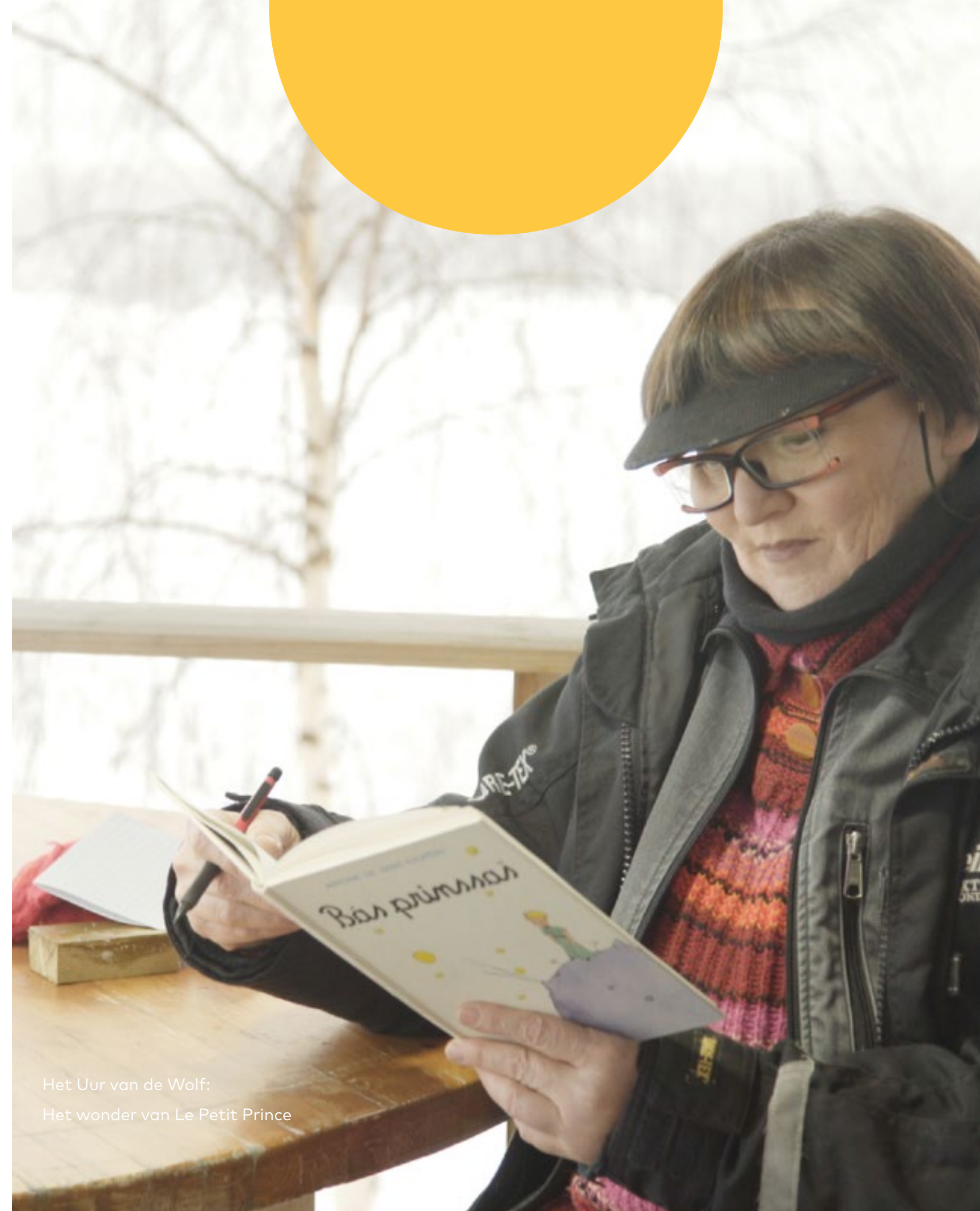
Het Uur van de Wolf: Het wonder van Le Petit Prince

In Beleef de Nachtwacht neemt acteur Nasrdin Dchar je mee in een audiotour op een interactieve ontdekkingstocht door het schilderij De Nachtwacht van Rembrandt van Rijn. Beleef de Nachtwacht is de derde interactieve kunstdocumentaire die door de NTR ontwikkeld is. Eerdere werken waren De tuin der lusten van Jheronimus Bosch en de Metamorfose van Escher.