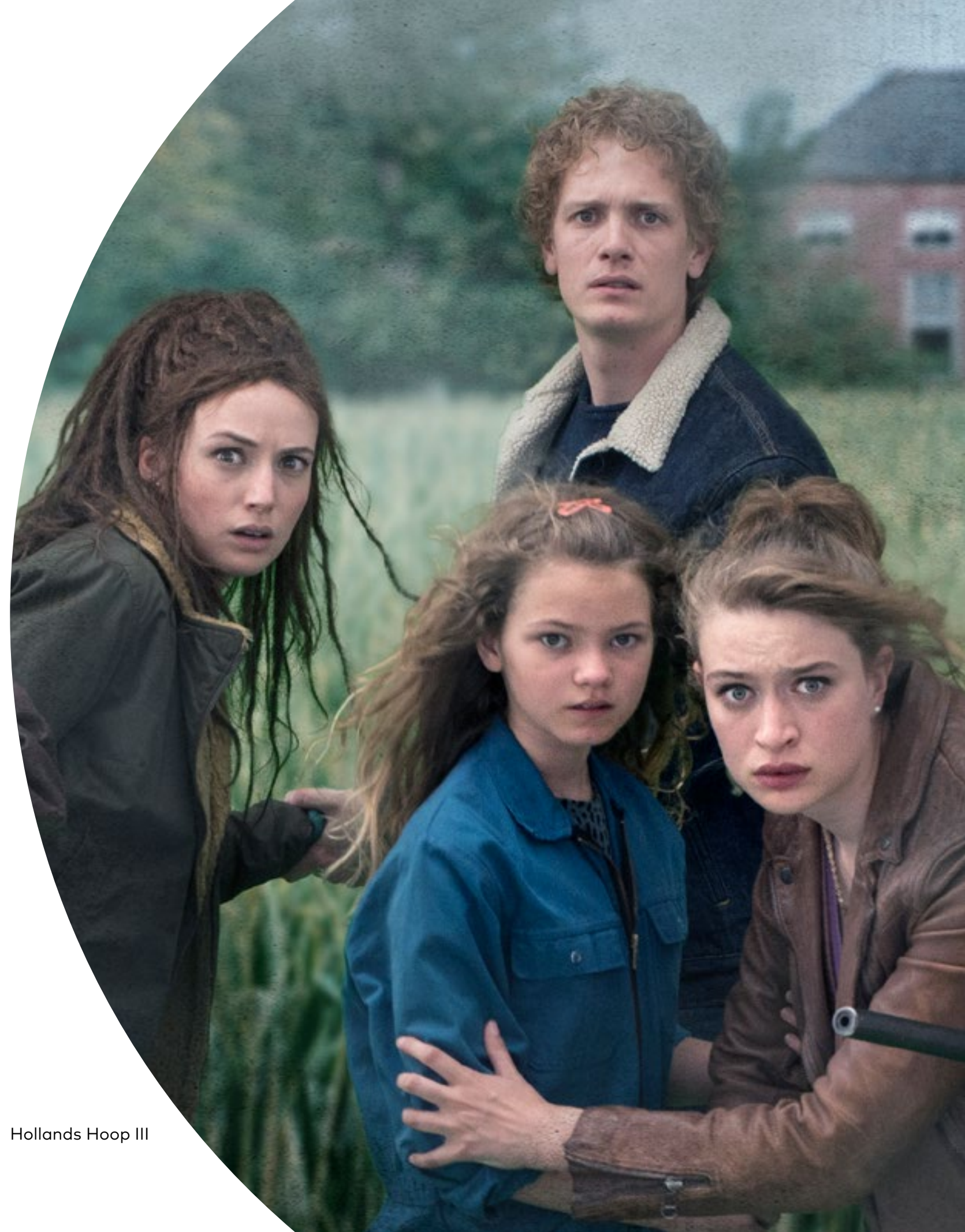
Hollands Hoop III

De NTR maakte in voorgaande jaren vooral drama voor NPO 2 (bv A'dam-E.V.A. en Hollands Hoop). Met ingang van 2019 deed die zender afstand van dramaprogrammering. Alle omroepen delen de zorg m.b.t. het ruimtegebrek voor kwalitatief hoogstaand drama (ontwikkeld vanuit het NPO-Fonds). NPO 1 is te breed, NPO 3 te jong. In 2020 moet blijken of het gebrek aan uitzendplekken zich laat rijmen met de ambitie om hoogstaand (NPO-fonds waardig) drama te produceren. Daarnaast vermeldt het concept beleidsplan de afbouw van 34 naar 15 series per jaar. Daardoor zal de druk op de NTR verder toenemen om een plek in de programmering te verwerven.