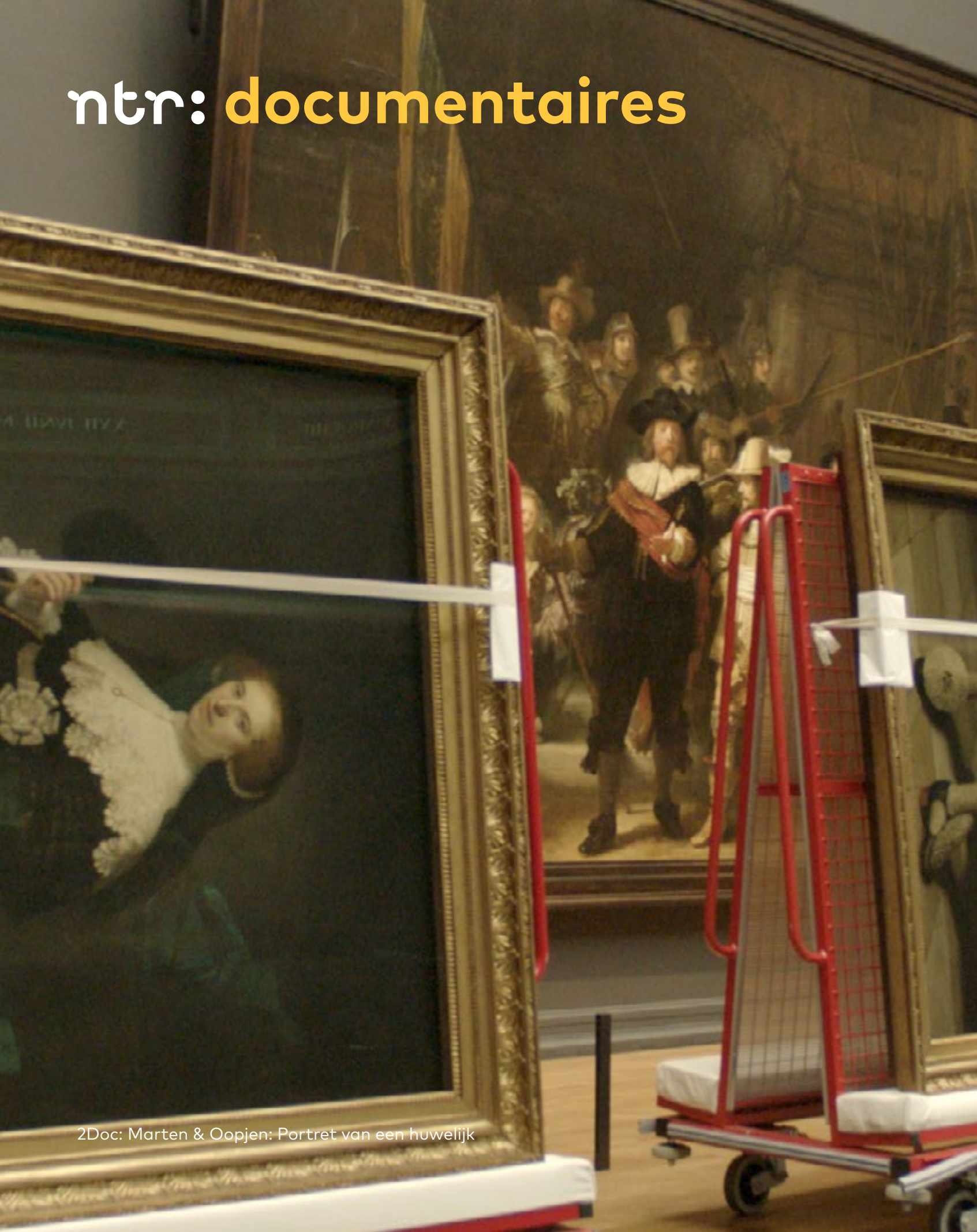
2Doc: Marten & Oopjen: Portret van een huwelijk