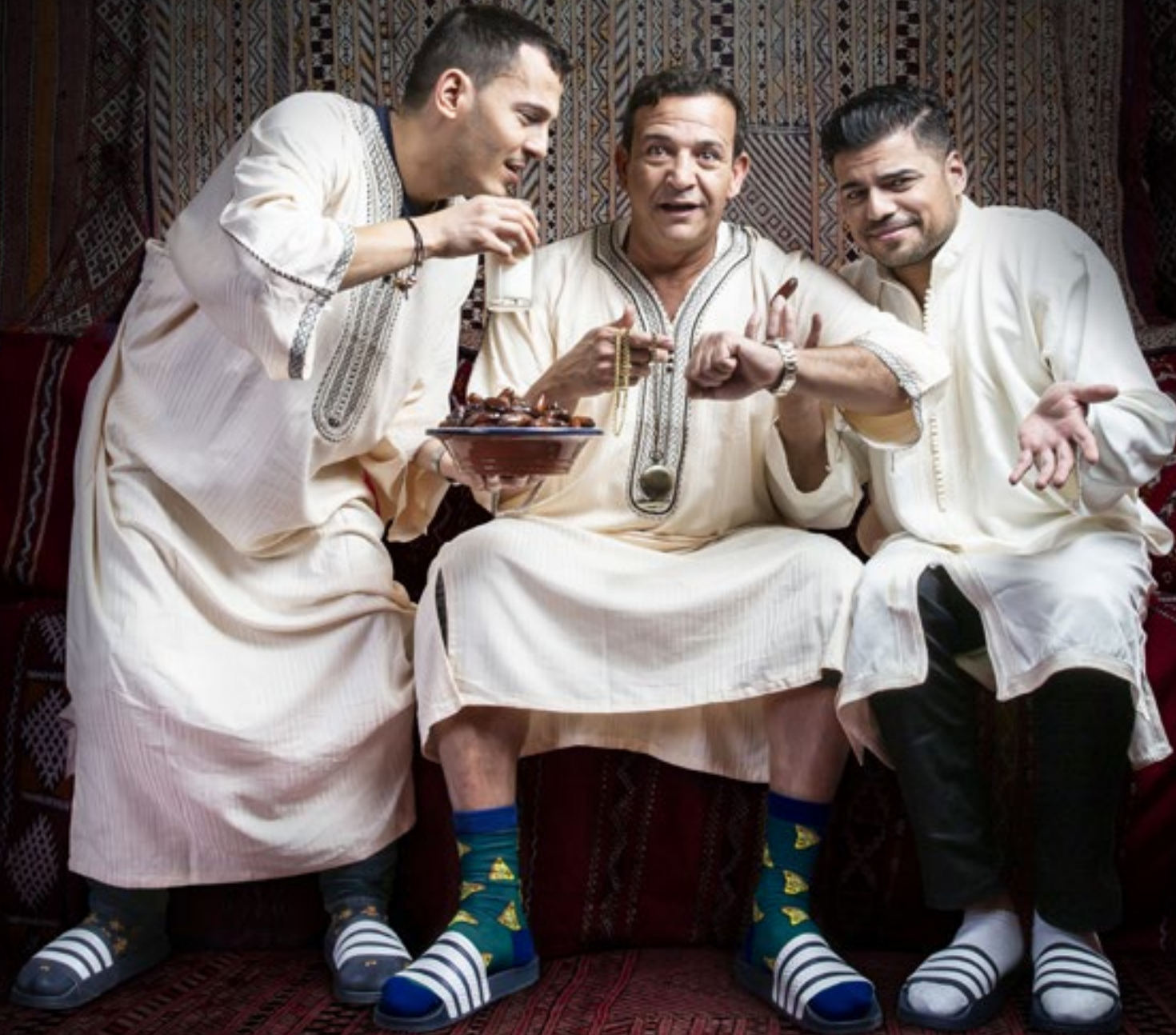
De Ramadan Conference