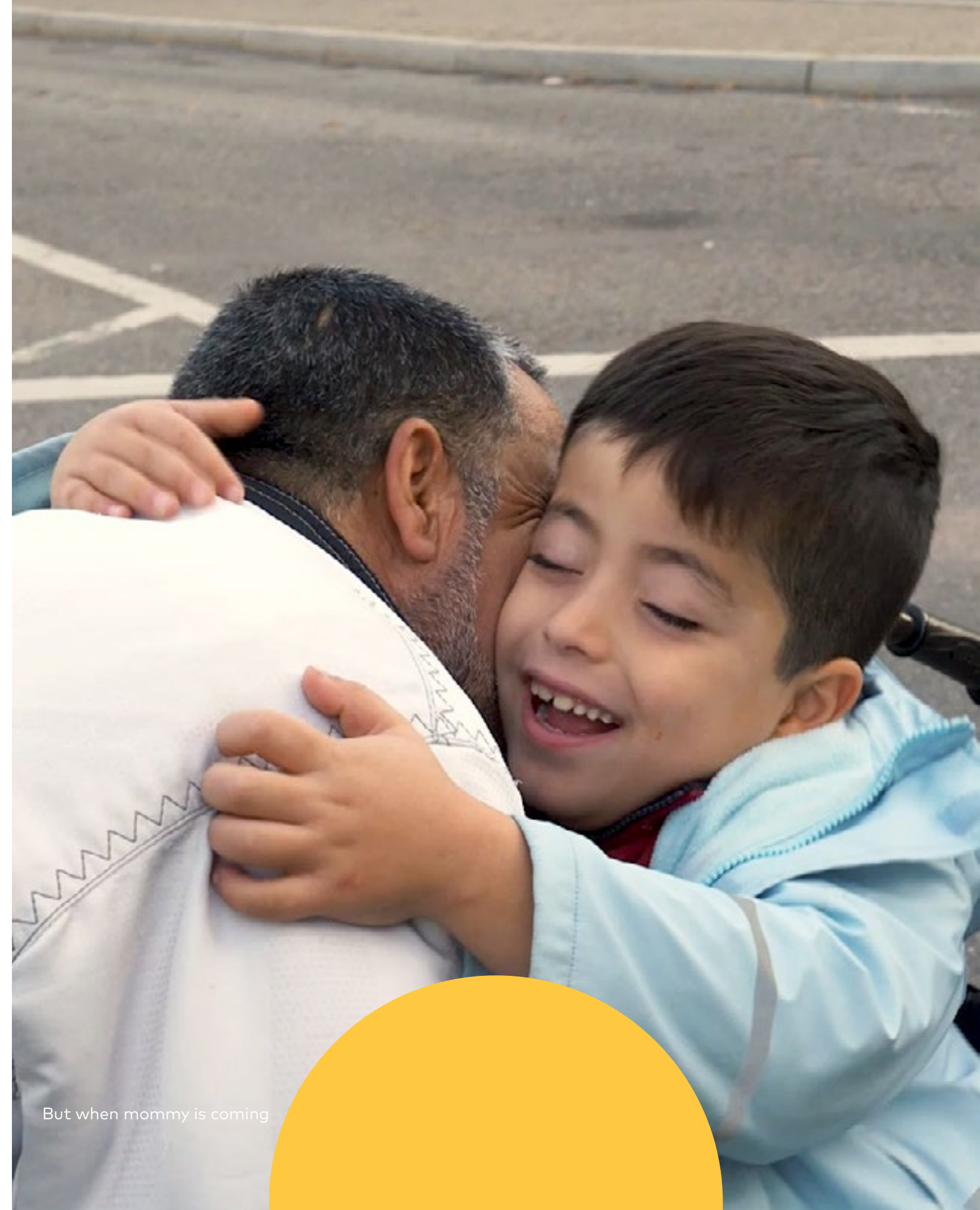
But when mommy is coming

Het tweede campagnejaar wordt afgesloten met een personeelsbijeenkomst. Ter inspiratie wordt daar But when mommy is coming getoond, de winnende documentaire van de Prix Europa Iris over een gehandicapt Syrisch kind dat met zijn vader en broertje naar Zwitserland is gevlucht. Ook wordt de Vrije Lijst gepresenteerd: een database met deskundigen, woordvoerders en gastsprekers van diverse afkomst, die iets kan toevoegen aan de spreekwoordelijke rolodex. De Vrije Lijst is voor intern gebruik. Een ambassadeursgroep van NTR-medewerkers, samengesteld uit bijna alle afdelingen, denkt mee over het verder uitbouwen van het project.