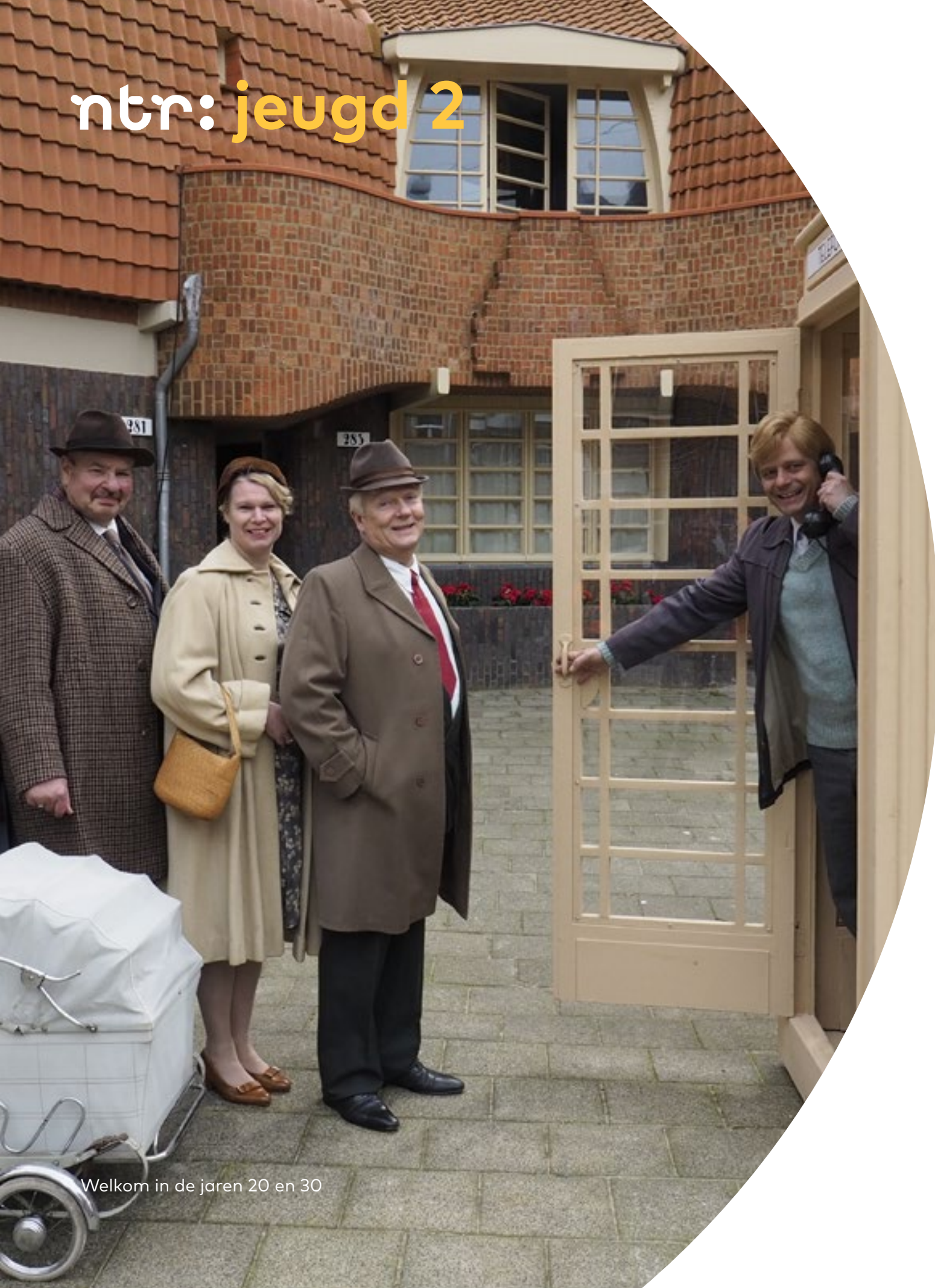
Welkom in de jaren 20 en 30

Met Welkom in de jaren 20 en 30 slagen de bedenkers erin het Welkom in...-concept (eerder succesvol met ...bij de Romeinen en ...in de Tachtigjarige Oorlog) een draai te geven. De serie wordt goed bekeken door kinderen én ouders. En dat niet eenmalig, maar telkens weer, want de NPO doet de series eindeloos in de herhaling. Een journalist noemde de serie 'zogenaamd voor kinderen', waaruit moge blijken dat iedereen er iets van zijn of haar gading vindt..