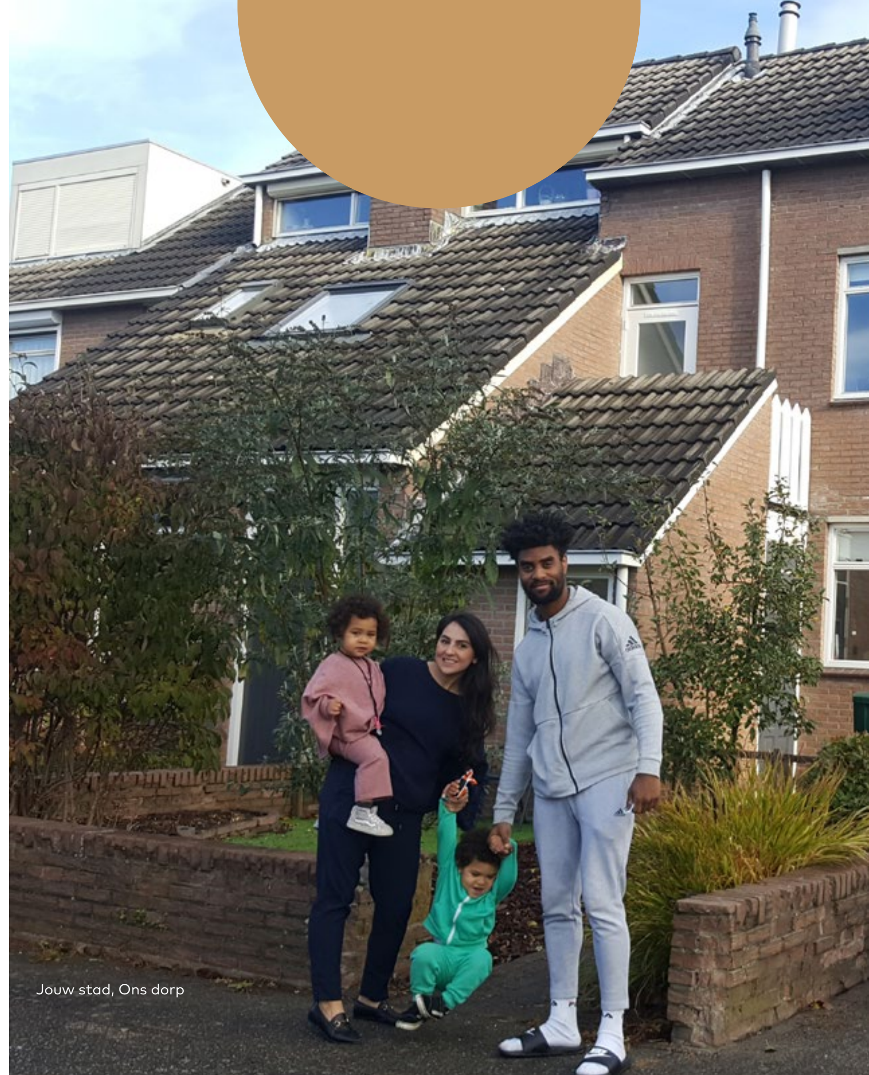
Jouw stad, Ons dorp