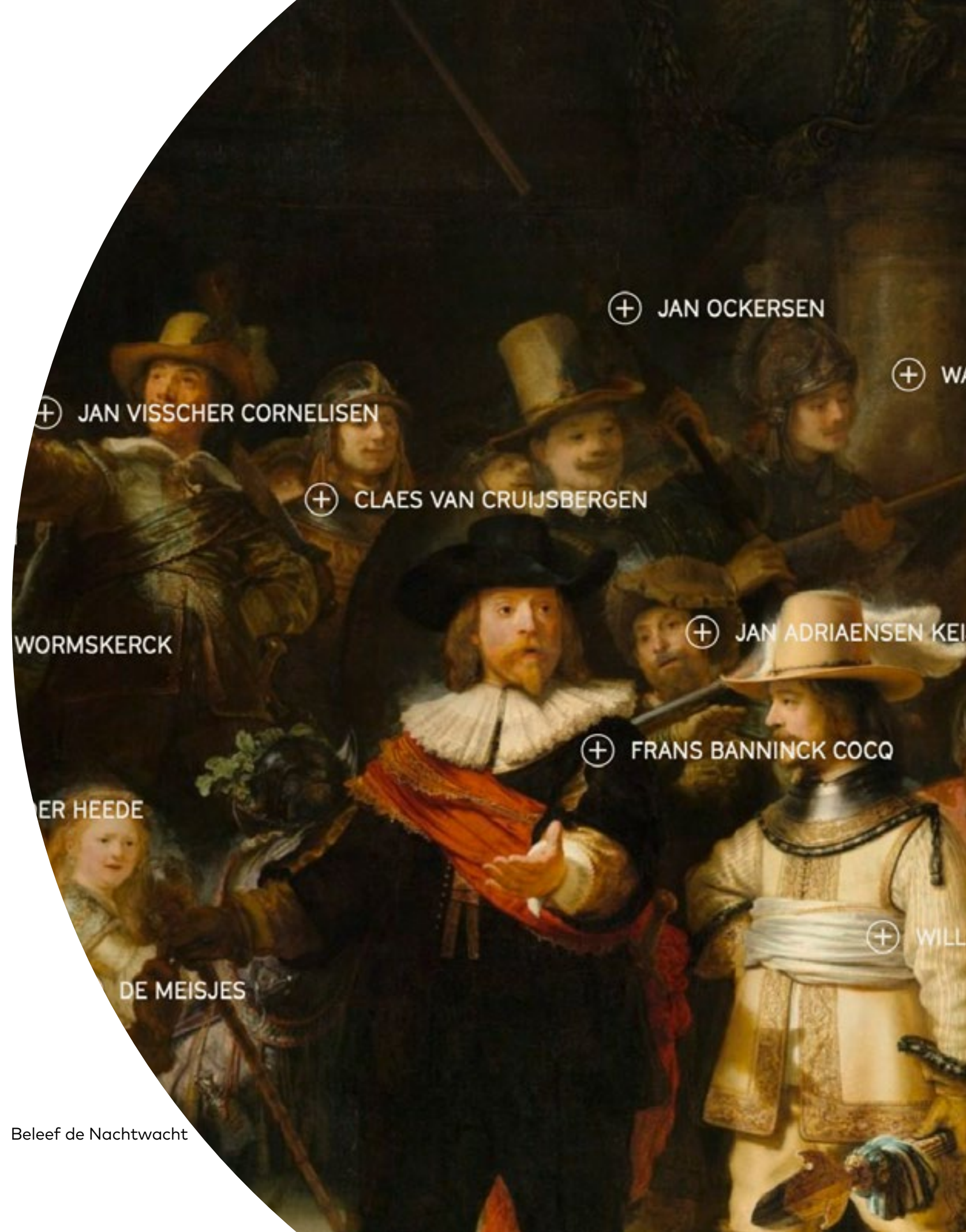
Beleef de Nachtwacht